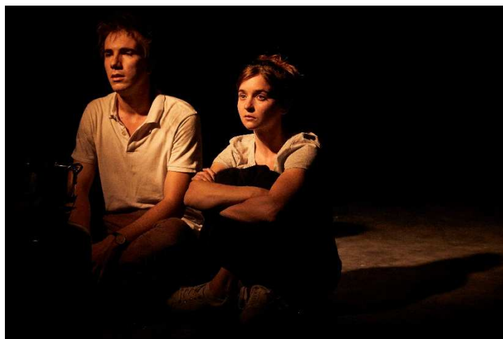
After the end